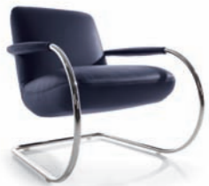
Sessel ARMCHAIR 2230

WHAT LOOKS GOOD WITH YOUR NEW DREAM SOFA? SELECT YOUR FAVORITES JUST ON WWW.SENECA-POLSTERMOEBEL.DE