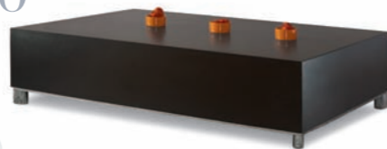
Tisch TABLE 4010