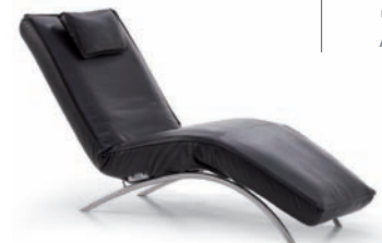
Relaxliege RELAXING RECLINER 2260