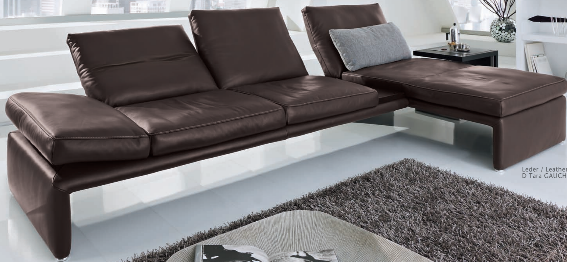
Leder / Leather: D Tara GAUCHO havanna

SLIM, REFINED, ALMOST AVANT-GARDE AND STILL A CLASSIC – A SOFA THAT NOT ONLY CATCHES YOUR EYE WITH ITS LOOKS BUT ALSO GRABS YOU WITH ITS GREAT SITTING AND RECLINING COMFORT.