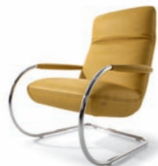
Sessel ARMCHAIR 2150