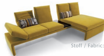
Stoff / Fabric: 20-622

Unterschiedliche, individuelle Wohnstile sind Ausdruck von Persönlichkeit. Das Designer Sofa ermöglicht durch zahlreiche Anbauvarianten volle Entfaltungsfreiheit bei höchstem Komfort. Die Rückenlehne und das Kopfteil sind für all Ihre Bedürfnisse individuell verstellbar. Die Armlehnen lassen sich über einen mehrstufigen Rasterbeschlag in die bevorzugte Position bringen.