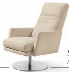
Sessel ARMCHAIR 2270