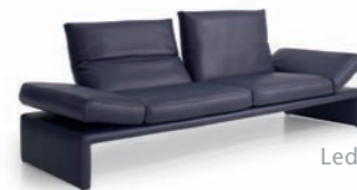
Leder / Leather: C Tara CLASSIC lila