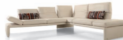
Leder / Leather: B Tara diamond