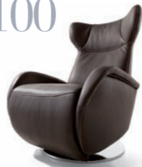
Relaxsessel RELAXCHAIR 2100

„Das habe ich doch immer gesagt, ein Designer-Sofa muss auf einen Kuschelfaktor nicht verzichten!“